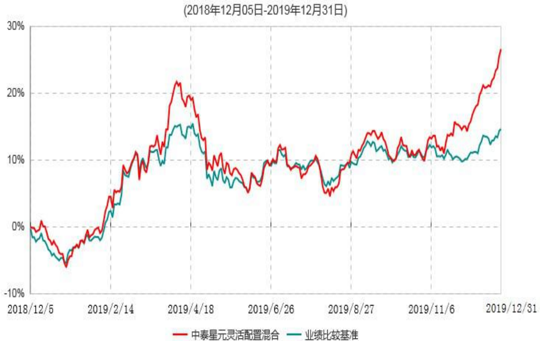
中泰星元价值优选灵活配置混合型证券投资基金累计净值增长率与业绩比较基准收益率历史走势对比图

注：根据基金合同约定，本基金自基金合同生效之日起6个月内为建仓期。建仓期结束时，本基金各项资产配置比例符合基金合同约定。