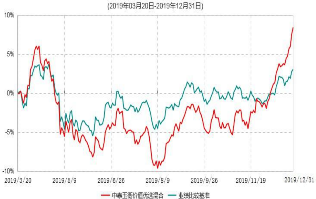
中泰玉衡价值优选灵活配置混合型证券投资基金累计净值增长率与业绩比较基准收益率历史走势对比图