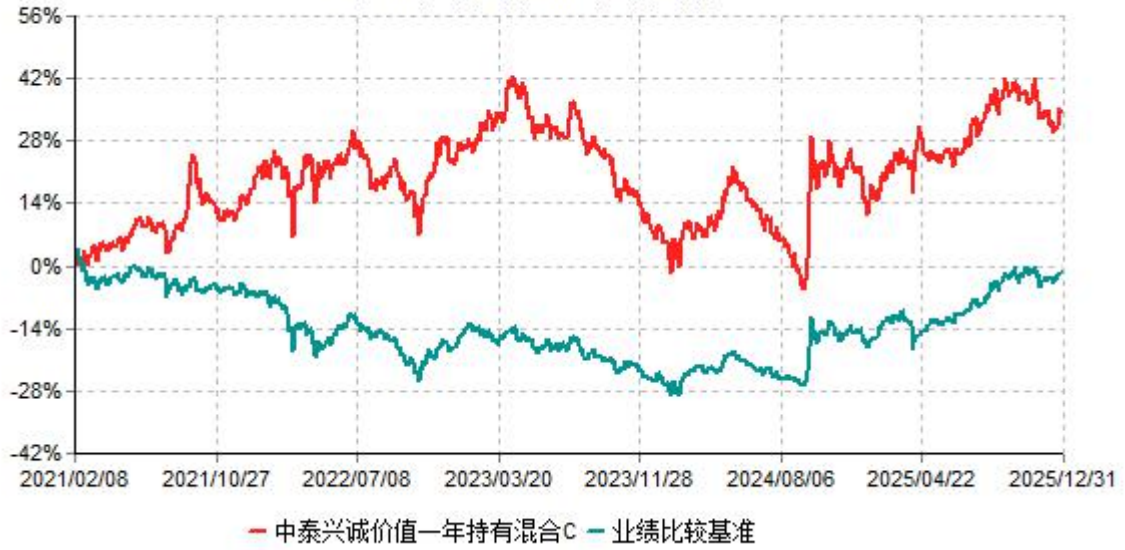
中泰兴诚价值一年持有混合C累计净值增长率与业绩比较基准收益率历史走势对比图 (2021年02月08日-2025年12月31日)