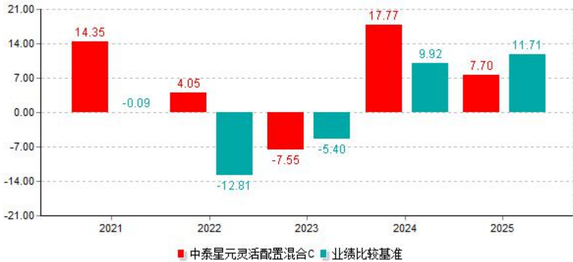
基金的过往业绩不代表未来表现，数据截止日：2025年12月31日 单位%

注：本基金2021年7月19日起增设C类份额，当年不满完整自然年度，按实际期限（2021年7月19日-2021年12月31日）计算净值增长率。