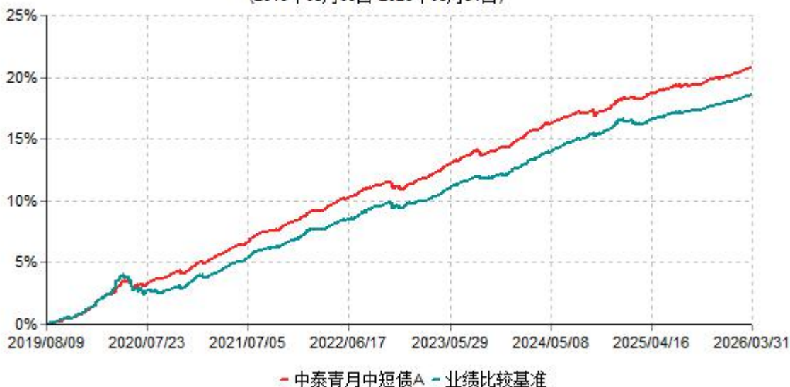
中泰青月中短债A累计净值增长率与业绩比较基准收益率历史走势对比图 (2019年08月09日-2026年03月31日)