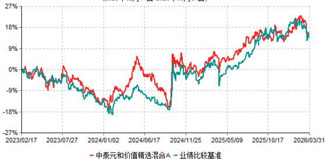
中泰元和价值精选混合A累计净值增长率与业绩比较基准收益率历史走势对比图 (2023年02月17日-2026年03月31日)