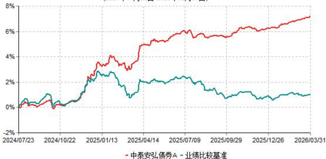
中泰安弘债券A累计净值增长率与业绩比较基准收益率历史走势对比图 (2024年07月23日-2026年03月31日)