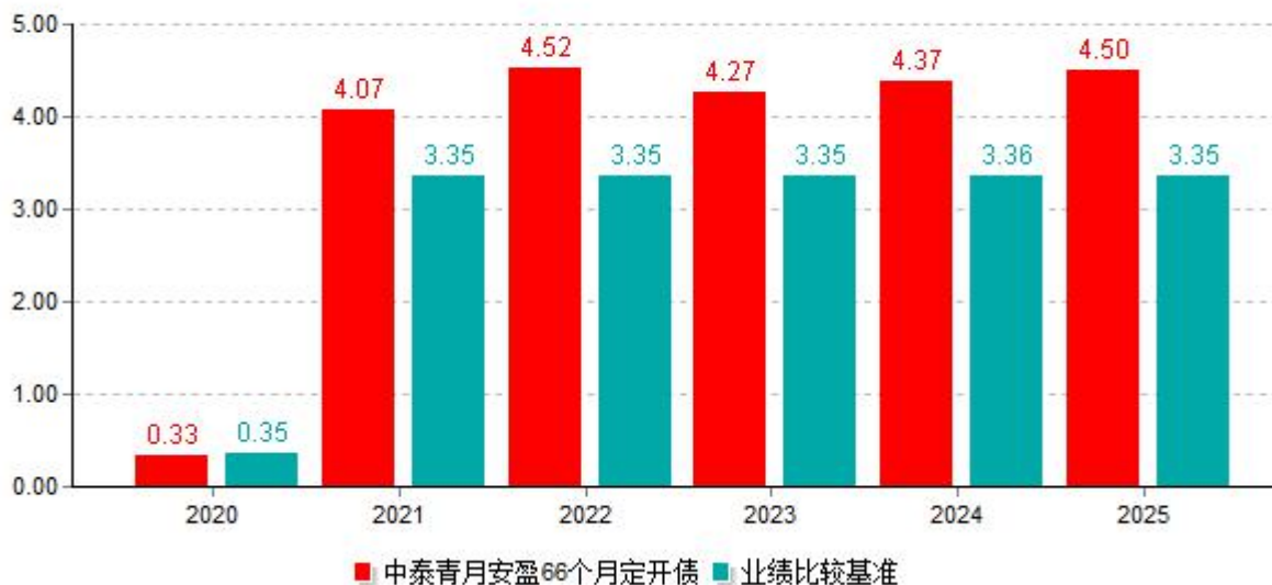
基金的过往业绩不代表未来表现，数据截止日：2025年12月31日 单位%

基金合同生效当年不满完整自然年度，按实际期限（2020年11月23日-2020年12月31日）计算净值增长率。